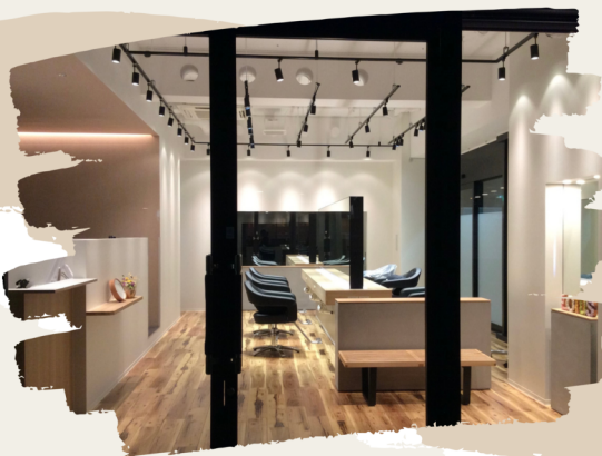
Lotus hair design 船橋店

Lotus hair designでは美容師という仕事に誇りを持ち成長できる環境づくりをしています。入社から2年でスタイリストデビューを目指す独自のカリキュラムを用意しており、確実に技術を身につけていくことができます。 働くお店によって技術に差が出る仕事であるからこそ、スタッフの技術成長にお店全体が責任を持ち自信を持ってデビューできるようサポートします。 プライベートとの両立ができるよう、練習は平均週3回時間を決めて行います。練習時間よりも成長度を重視し短い時間で技術を身につけるように徹底しています。 有休休暇の取得率は毎年100%です。自分の時間を大切にしながら美容師という仕事を楽しくもらえるようにリフレッシュの時間を大切にしています。 社内イベントもあり先輩後輩の仲の良さ、居心地の良さが一番の自慢です。 是非一度気軽に見学に来てください。