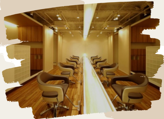
Lotus hair design 西船橋店